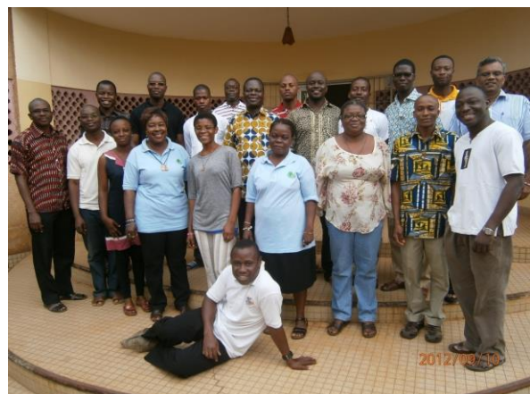
SVD-Freundeskreis in Ghana

Er hat im Oktober als Vertreter unseres Freundeskreises am Internationalen Workshop der SVD-Lay-Partner in Nemi teilgenommen.